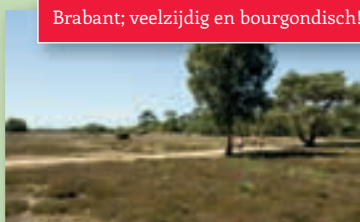
Brabant; veelzijdig en bourgondisch!