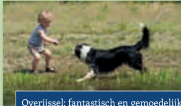
Overijssel; fantastisch en gemoedelijk!