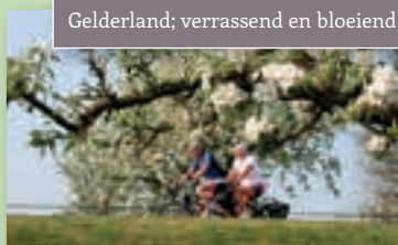
Gelderland; verrassend en bloeiend!