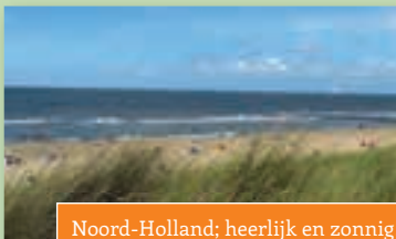
Noord-Holland; heerlijk en zonnig!