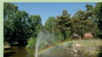
Limburg; onvergetelijk en mooi!