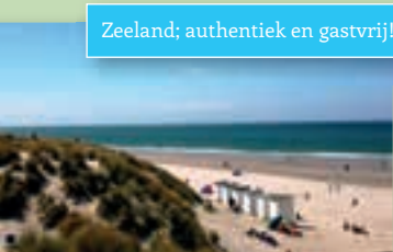
Zeeland; authentiek en gastvrij!