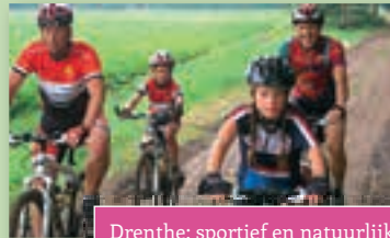
Drenthe; sportief en natuurlijk!